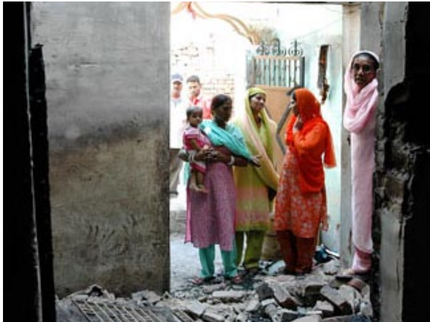
In Gohana in de Indiase deelstaat Haryana werden vorig jaar vijftig huizen van dalits (kastelozen) geplunderd en in brand gestoken door leden van hogere kasten.

De organisatie van Divakar is een landelijke belangenclub die opkomt voor dalitrechten. Grofweg zijn er 180 miljoen hindoeïstische dalits en veertig miljoen christelijke, islamitische en boeddhistische