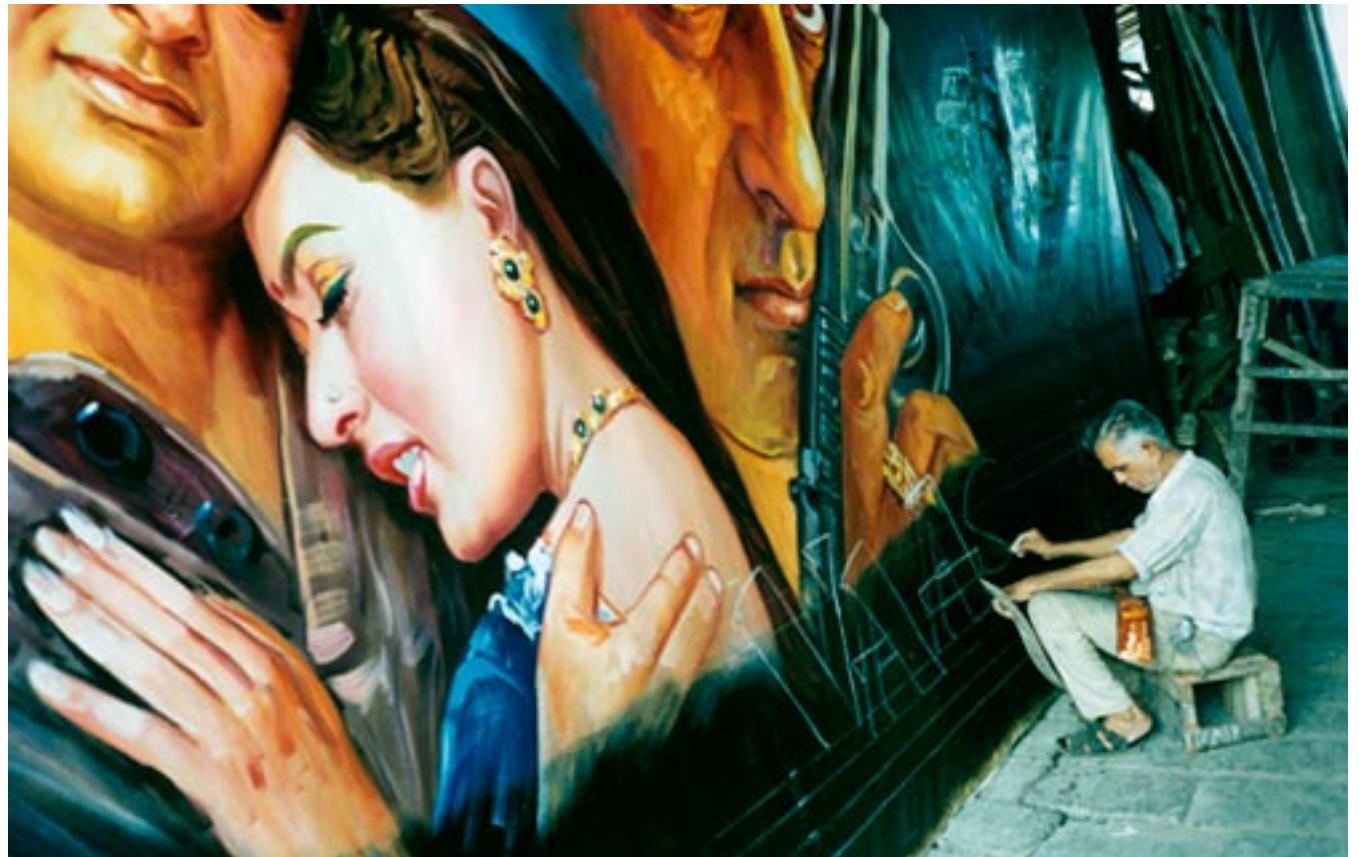
Atelier voor filmaffiches in Mumbai

Daarvoor zorgt de Central Board of Film Certification van de overheid, ook wel de Censor Board genoemd. Speciale commissies bepalen per regio voor welke leeftijden de films zijn en of ze beelden bevatten die