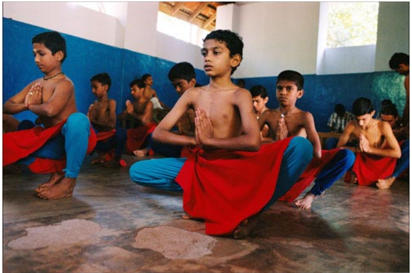
Jongens in India krijgen les in traditionele dans.

In veel landen, van Oost-Azië tot Noord-Afrika, wijkt de 'sekseratio' (de getalsmatige verhouding tussen mannen en vrouwen) af van de algemeen aanvaarde standaard – 106 jongens op 100 meisjes. Ouders hebben liever zonen, omdat die voor meer inkomen zorgen, de familielijn voortzetten en voorrang krijgen bij het erven van bezit. Meisjes gelden als een kostenpost, omdat ze op den duur deel gaan uitmaken van de familie van hun man – en dan geen verantwoordelijkheid meer dragen voor hun eigen ouders – en vaak een bruidsschat moeten meebrengen.