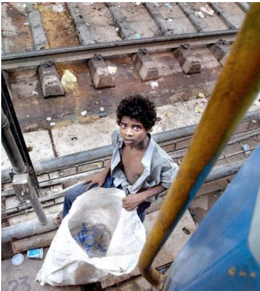
Een Indiase jongen verzamelt gebruikte plastic flessen langs het spoor van New Delhi.

Volgens de VN-vluchtelingenorganisatie UNHCR heeft Delhi tussen de 100.000 en 500.000 straatkinderen, terwijl hulporganisaties het op ongeveer 250.000 houden. In totaal zouden in India, volgens de UNCHR, zo'n achttien miljoen straatkinderen zijn. Staten als Bihar en Uttar Pradesh zijn de regio's waar de meeste kinderen die naar Delhi gaan vandaan komen.