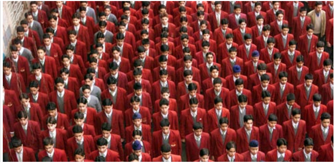
Studenten in de Indiase stad Srinagar tijdens het ochtendgebed. De enorme aantallen studenten aan Indiase universiteiten maken het bijna onmogelijk om leerlingen praktische vaardigheden bij te brengen.

naartoe gaan omdat ze in Nederland of de VS niet genoeg werknemers kunnen vinden. Het land dat te boek staat als de nooit haperende ingenieursfabriek die elk jaar miljoenen talentvolle afgestudeerden uitspuwt. En het land waarvan westerse schoolverlaters te horen krijgen dat er miljoenen leeftijdsgenoten wonen die slimmer, gemotiveerder en minder verwend