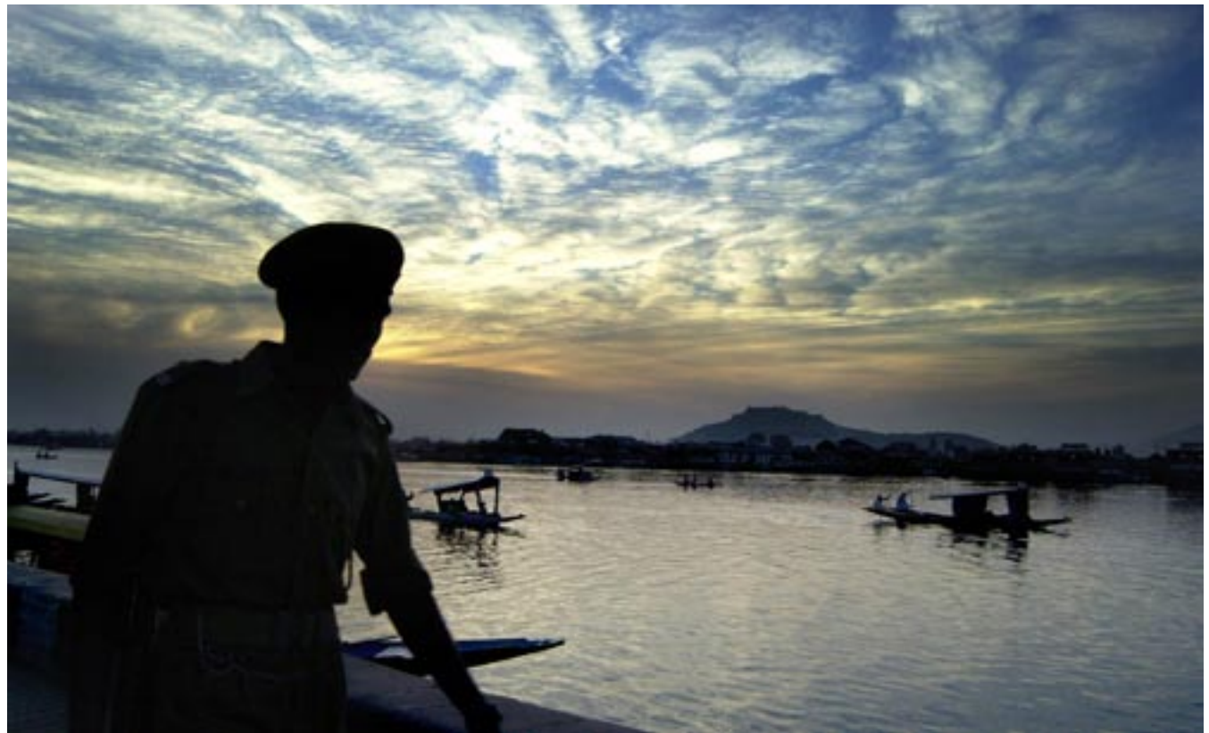
Een Indiase militair kijkt uit over het Dalmeer in de provincie Srinagar in Kashmir. India en Pakistan voeren oorlog over de deelstaat Kashmir.

Een ander terugkerend probleem is het religieuze geweld. Vooral dat tussen hindoes en moslims, die met 150 miljoen nauwelijks een minderheid te noemen zijn. Dieptepunt was de vernietiging in 1992 van een historische tempel in Ayodhya door radicale moslims. Ook zijn er van tijd