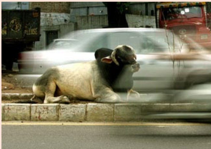
Heilige koe ligt op de middenberm in New Delhi.

Het blijft dus een mooie menselijke eigenschap, de heiligverklaring, zoals Naipaul zei, maar het is een primitieve eigenschap als daarop geen Verlichting, geen onderzoek en dus geen wetenschap volgt. Heilig verklaren om het heilig verklaren is beslist een stadium van beschaving, maar ook (een) vrij zinloos. Dat is wat godsdienst zo zinloos maakt maar dat is, geloof ik, niet echt een originele opmerking.